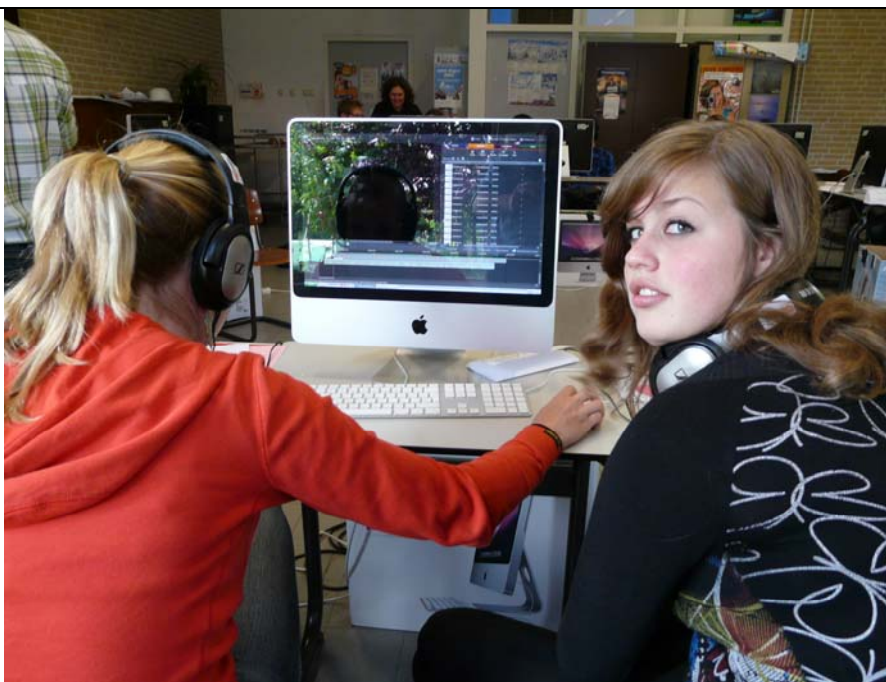
Werken aan het maken van een PoëzieClip