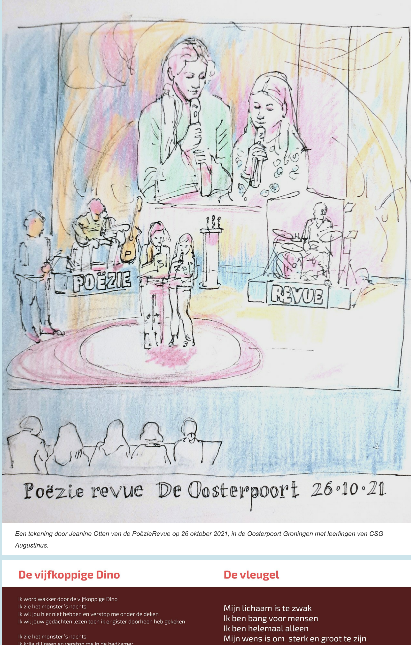
Poëzie revue De Oosterpoort 26.10.21